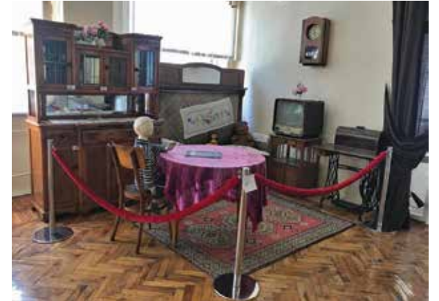
Городской музей истории города Батайска.