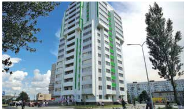
Дом дольщиков СЖМ-16.

введение новых микрорайонов в рамках комплексного развития территории. Так, уже реализован земельный участок на шоссе Восточном. Идет подготовка к заключению договора. При застройке здесь появятся не только дома, но и детский сад на 250 мест, начальная школа на 140 мест, детская школа искусств на 50 мест. Также продолжается строительство средних школ. Одна, на 600 мест, расположена на улице Огородной, 78, другая, на 1340 учеников, находится в районе Авиагородок, 44-А. В 2021-м в рамках исполнения поручения губернатора Ростовской области в микрорайоне РДВС определен участок для размещения модульного здания поликлиники для взрослых. Строительство планируется начать в следующем году. В ближайшие годы приоритетными направлениями будут работы по строи-