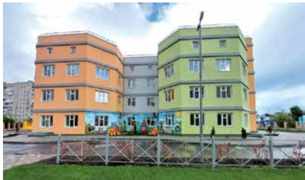
Детский сад № 17 «Я сам».