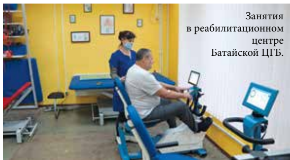
Занятия в реабилитационном центре Батайской ЦГБ.

Беседовал Геннадий Громов, фото предоставлены МБДОУ № 22 города Батайска